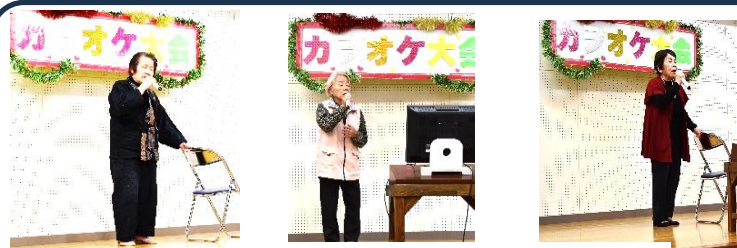
町内フェス・歌うまい！姿勢がい