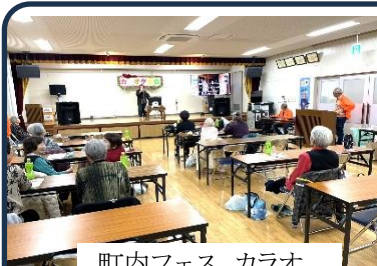
町内フェス カラオ