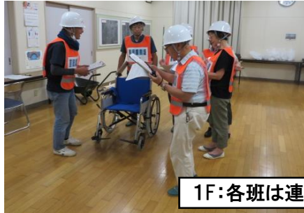
1F:各班は連絡を受け行動