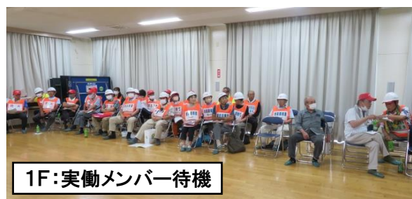
1F:実働メンバー待機

① 本部を立ち上げ、各班を集合させる ② 情報を受理して、本部を通じて各班に伝達