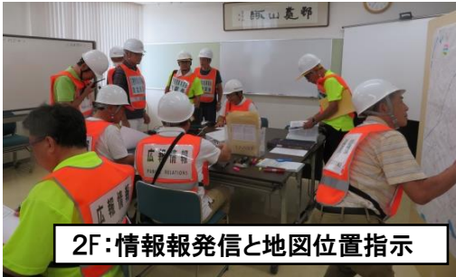
2F:情報報発信と地図位置指示