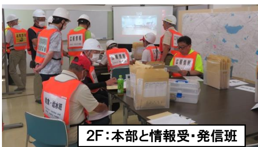
2F:本部と情報受・発信班