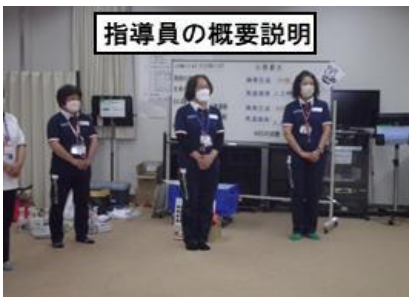
指導員の概要説明