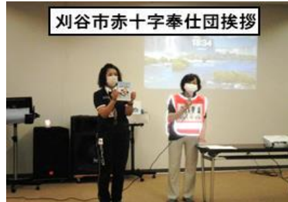
刈谷市赤十字奉仕団挨拶