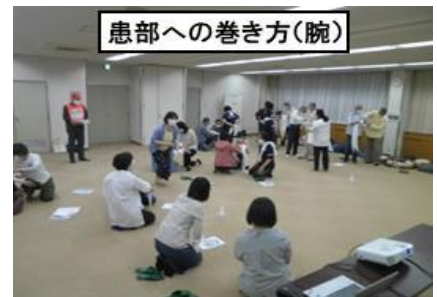
患部への巻き方(腕)