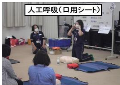
人工呼吸(口用シート)