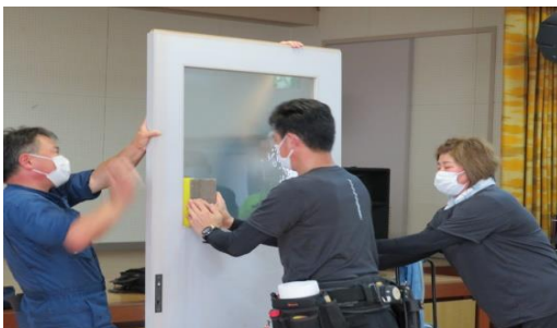
業者による貼付実演

参加人数32名。業者によるガラス飛散防止フィルム貼付の実演を参観しました。何より避難時の動線を確認することが大切であることを学びました。