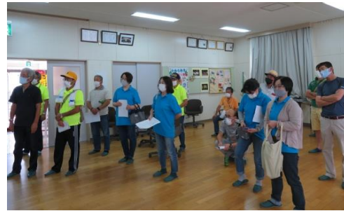
実演を見守る参加者